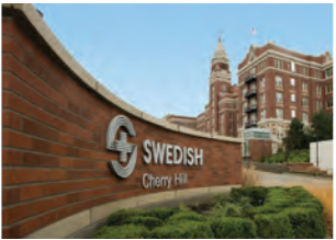
SWEDISH CHERRY HILL