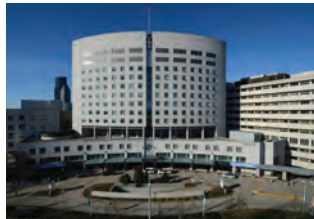
SWEDISH FIRST HILL

ኣብዚ ዘለኩም ልምዲ ምቹእነትን ዓርሰ ምትእምማንን ንክሰማዓኩም ከምዝገብር ንእምን። ስርሓም ብዝፈቱ ኣብ ዝሰርሑም ክኢላታት ዝኾኑን ንጥዕናኹም፣ ድሕነትን ምቹእነት ጻዕሪ ዝገብሩ ኣገዳሲ ክንክን ጥዕናን ዝማዕበለ ጽፈት ዘለዎ ወሃብቲ ንምቕባል/ንምርካብ ንዓና ስለዝመረጽኩም ክብሪ ይስመዓና።