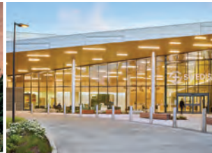
SWEDISH EDMONDS (በ NBBJ ፈቃድ)