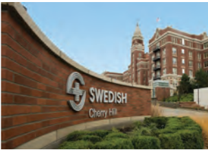
SWEDISH CHERRY HILL