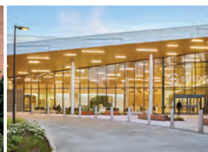
SWEDISH EDMONDS (courtesy of NBBJ)